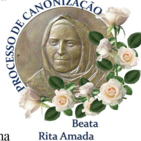
Beata Rita Amada