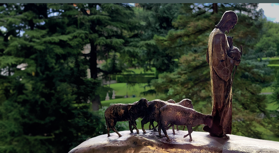
Imagem: escultura de Jesus, como pastor de ovelhas, com vista para o jardim dos Museus do Vaticano ao fundo.

Saudamos com carinho os leitores do Boletim “Ecos da Canonização” e todos os devotos da Beata Rita Amada de Jesus.